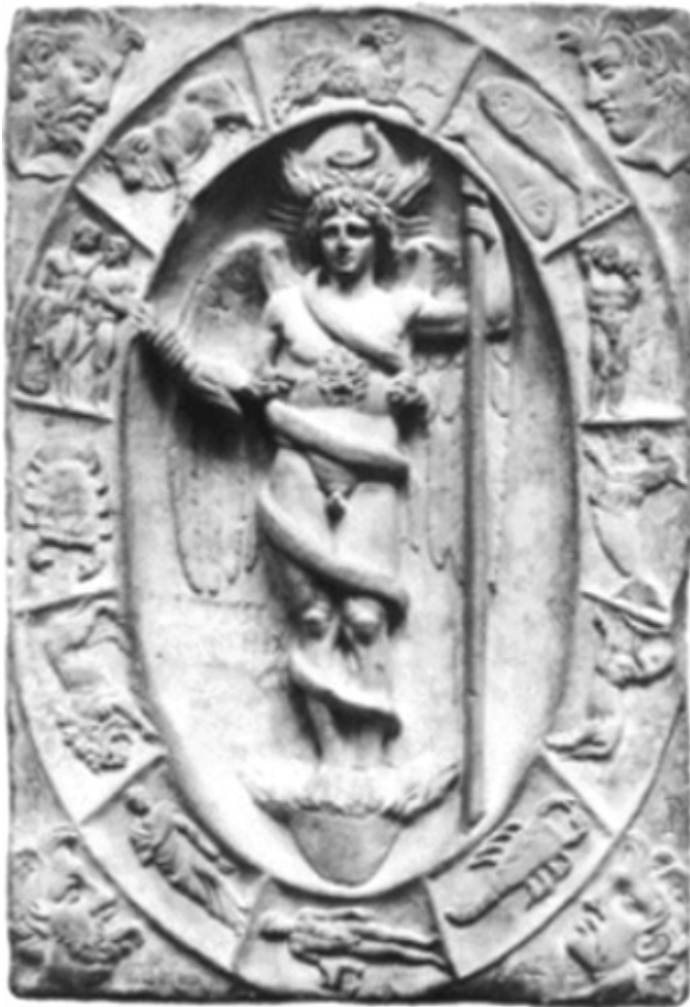
Griekse Phanes in het komisch ei

Het ei als symbool van leven en de oorsprong van universum hebben we ingeruild voor een paashaas en chocolade eitjes. Wat zouden archeologen over pak-em-beet 2000 jaar denken als onze huidige beschaving opgraven?