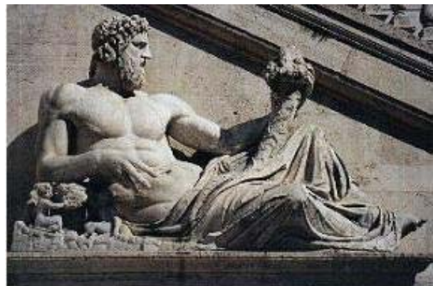
Rome: riviergod met hoorn des overvloeds