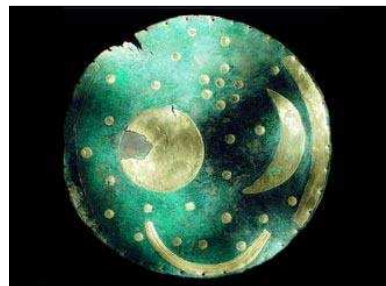
De hemelschijf van Nebra

Op de Mittelberg in Duitsland is een beroemde vondst gedaan: de hemelschijf van Nebra. Op deze bronzen schijf staan de zon, de maan en verschillende punten die sterren kunnen voorstellen. Verder staan er twee gebogen lijnen op waarvan er een, gezien vanaf de vindplaats, de plek van de zonsondergang met zowel midzomer als midwinter aan de horizon aangeeft.