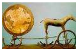
De zonnwagen van Trondheim

Een andere vondst die wijst op een cultus waarin zon en maan belangrijk waren is de 'zonnwagen van Trondheim'. Dit is een klein beeldje van paard en wagen met op de wagen een grote schijf die aan de ene kant blinkt en aan de andere kant veel doffer is. Hij is gemaakt rond 1400 vjt en geofferd in een veen in Denemarken.