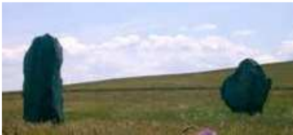
twee stenen van de avenue in Avebury

Ook in de Britse eilanden vinden we aanwijzingen voor het belang van vruchtbaarheid. In Avebury loopt er een weg van een klein monumentje dat sanctuary gedoopt is naar het grote monument bij het dorpje Avebury. Dit monument bestaat uit een henge, een ronde aarden wal met een greppel er omheen met daarin twee steencirkels. De weg van de sanctuary naar de henge is aangegeven door paren stenen. Aan de ene kant staan brede stenen en daar tegenover aan de andere kant smallere stenen. De interpretatie is dat de brede stenen een vrouwelijk symbool zijn en de smalle stenen een mannelijk symbool.