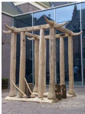
Tempeltje van Barger-Oosterveld (replica)

Het offeren van venen, meertjes en stromend water was een gewoonte die al duizenden jaren bestond maar in de bronstijd in belang toenam. Bijlen van steen en brons waren de belangrijkste offergaven naast allerlei andere voorwerpen zoals geweien, hoorns, wielen, wapens, ketels, sieraden en de kostbaarheden hierboven. Er waren zelfs speciale houten platforms om vanaf te offeren die te bereiken waren met knuppelpaadjes door het veen.