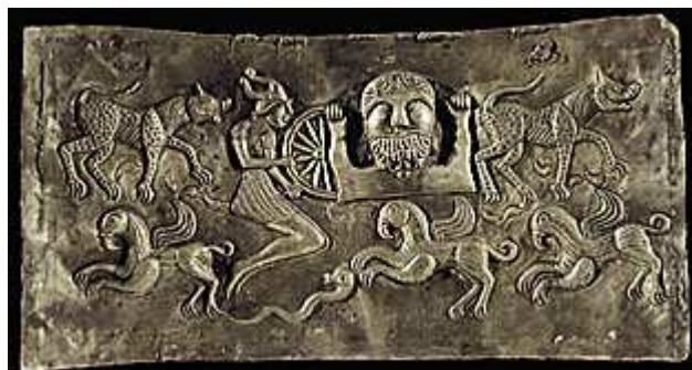
Afbeeldingen van (vermoedelijk) de godin Morrigan en de god Taranis op de Gundestrup ketel.