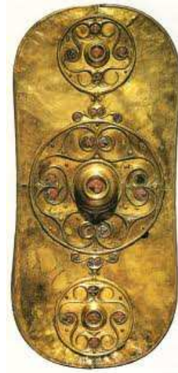
Battersea schild in La Tene stijl

Rond 450 vjt ontstaat er in de Moezelvallei en de Marnevallei een nieuwe stijl die de La Tene cultuur genoemd wordt. Deze stijl gebaseerd op ingewikkelde vlechtpatronen gaat in hoog tempo de Hallstattcultuur overvleugelen. Met de overgang naar de La Tene cultuur komt ook het krijgerselement nog sterker naar voren. Leiders uit de Hallstatt periode werden begraven in vier wielige karren met ceremoniële - en jachtwapens en de La Tene leiders in strijdwagens met oorlogswapens. Als grafgift werd vaak drinkgerei met Grieks en Etruskisch aardewerk meegegeven want de La Tene krijgerselite stond bekend om haar drinkgelagen.