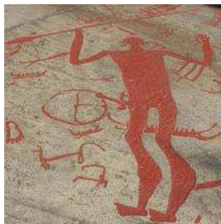
'Odin' als rotstekening

Dat de zon, en wellicht ook de maan, een belangrijke plek hielden in het spirituele gedachtegoed blijkt uit de rotstekeningen in met name Scandinavië waarin wielen met vier of meer spaken veel voorkomen als rotstekening. Deze wielen stellen hoogstwaarschijnlijk de zon voor.