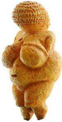
Venus van Willendorf

We weten alleen dat de beeldjes sterk op elkaar lijken en in een uitgestrekt gebied gevonden zijn wat er op wijst dat het religieuze gedachtegoed erbij waarschijnlijk goed uitgewerkt en wijd verbreid was. De cultus rond de venusbeeldjes heeft desondanks vrij kort bestaan, ongeveer 2000 jaar, en is daarna verdwenen.