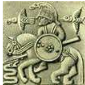
Odin te paard

en dichters. Odin ontdekte de runen, bedreef magie en was constant op zoek naar wijsheid.