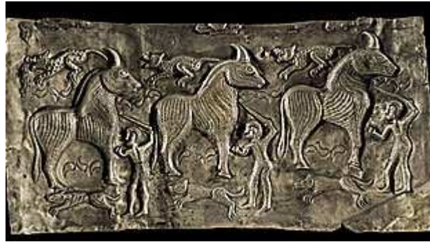
Afbeeldingen van een verdrinkingsoffer en een stierenoffer op de Gundestrupp ketel

Veel van deze offers vonden plaats in heiligdommen en werden uitgevoerd door priesters. Die heiligdommen waren in eerste instantie heilige bossen, meestal natuurlijke bossen maar soms ook aangeplante bossen of zelfs door rechtopstaande boomstammen nagebootste bossen. Uit veel vondsten blijkt dat bomen voor de Kelten een belangrijke spirituele betekenis hadden. Hiernaast kenden de Kelten ook gebouwen die als heiligdom dienst deden.