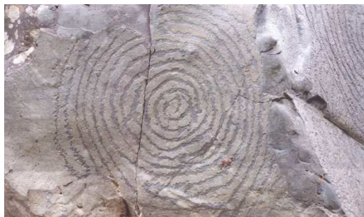
Rotsgravure bij bronheiligdom op La Palma

Het is waarschijnlijk dat de mensen in de nieuwe steentijd geloofden dat er naast onze gewone wereld van mensen, dieren en planten ook nog andere werelden waren, waar spirituele wezens woonden. Er zijn door heel Europa honderden of duizenden offerplaatsen uit deze periode bekend en hierbij valt het op dat deze zich vaak bevonden bij rivieren, meren, moerassen, bronnen, grotten, aan de kust of juist hooggelegen plaatsen zoals bergtoppen. Ook werden er tientallen meters diepe putten gegraven waarin offers werden gedaan.