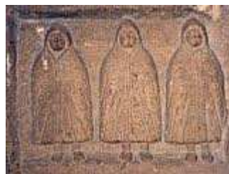
Matrones en 'bemutste geesten'

De Kelten kenden ook aan de zon een religieuze betekenis toe. Ze hadden een zonnegod die in Oostenrijk Belenus heette en op andere plaatsen wellicht andere namen had. Hiernaast is er een 'Keltische Jupiter' geweest die vrij algemeen vereerd werd en misschien dezelfde godheid als Taranis was. Hij werd vaak afgebeeld met een zonnewiel zoals we die al eerder in Scandinavië zagen.