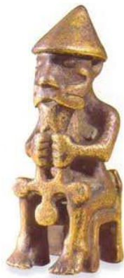
Thor / Donar

Ook de bekende dondergod Thor of Donar is al in de bronstijd terug te vinden. Als hij met zijn bokkewagen over de wolken rijdt veroorzaakt hij de donder en door zijn strijdhamer Mjolnir te gooien de bliksem. Thor is de grote bestrijder van de reuzen die de wereldorde bedreigen. Vanwege zijn enorme kracht en zijn strijdlust was hij erg populair onder krijgers. Zij droegen vaak zijn strijdhamer als amulet om hun hals. Odin en Thor behoren beide tot het Asengeslacht.