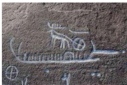
Rotstekening met zonnelymbolen

Bij diezelfde tekeningen vinden we vanaf de ijzertijd mensfiguren die vermoedelijk Goden voorstellen die we kennen uit de latere pantheons van de Germanen en Kelten. Zo zijn er afbeeldingen van een man met een bijl en een man met een speer die voorlopers van Thor en Odin kunnen zijn. Uit de Italiaanse Alpen kennen we een rotstekening die de latere Keltische god Cernunnos voorstelt.