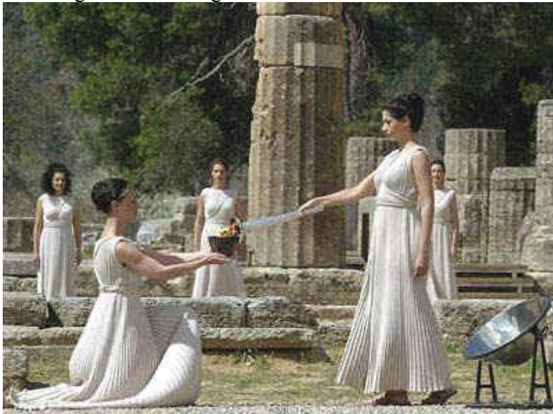
De Olympische vlam, of Olympisch

De antieke Spelen waren verbonden aan Zeus, de Griekse oppergod. Dit vuur werd brandende gehouden gedurende de Spelen. De vlam ervan werd, net als alle andere offers, aangestoken met het heilige vuur van de godin Hestia.